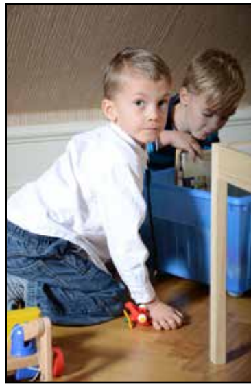
Lekhörna för de minsta