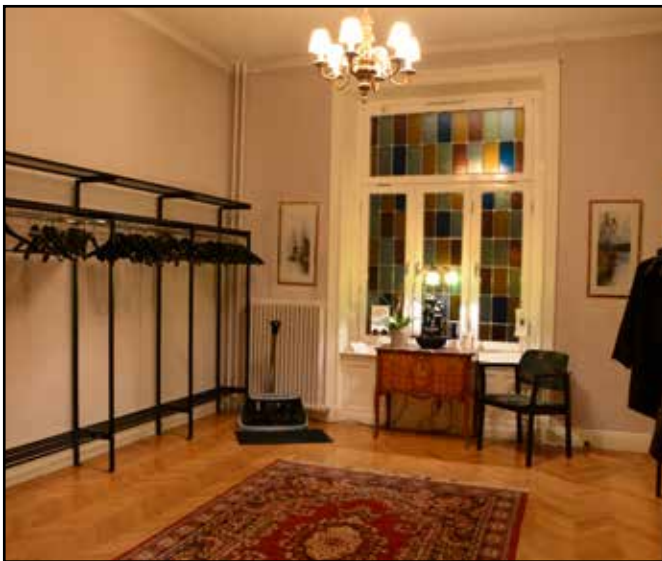
Stort kapprum med utrymme för många gäster