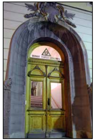
Entrén från gatan